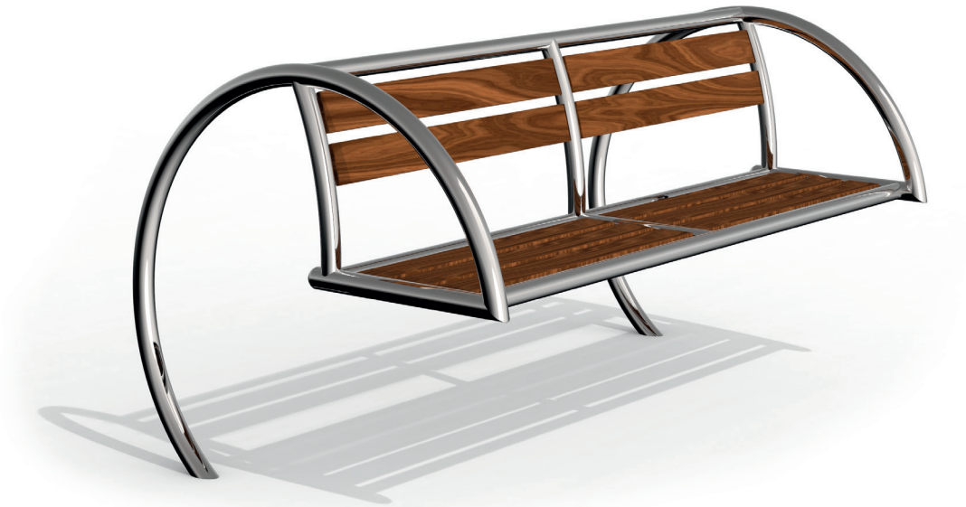
Skizze 1: Gesamtansicht