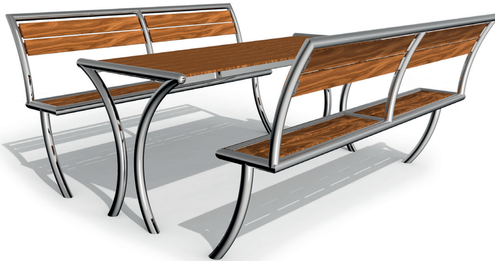
Skizze 1: Gesamtansicht