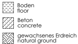
Skizze 2: Fundamentplan