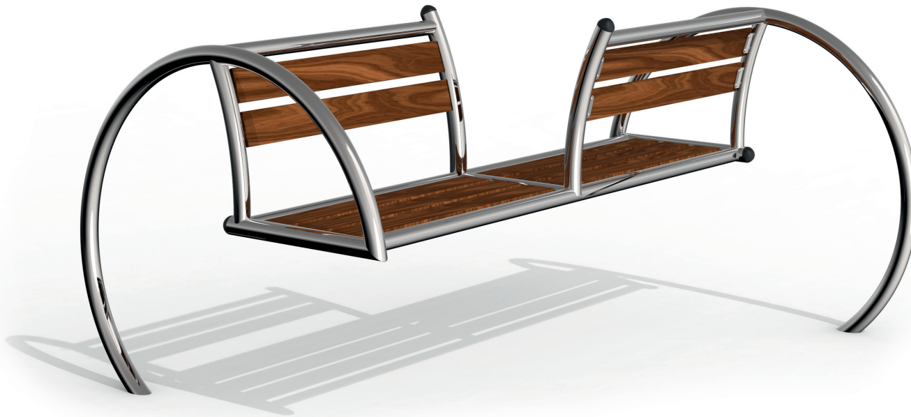
Skizze 1: Gesamtansicht