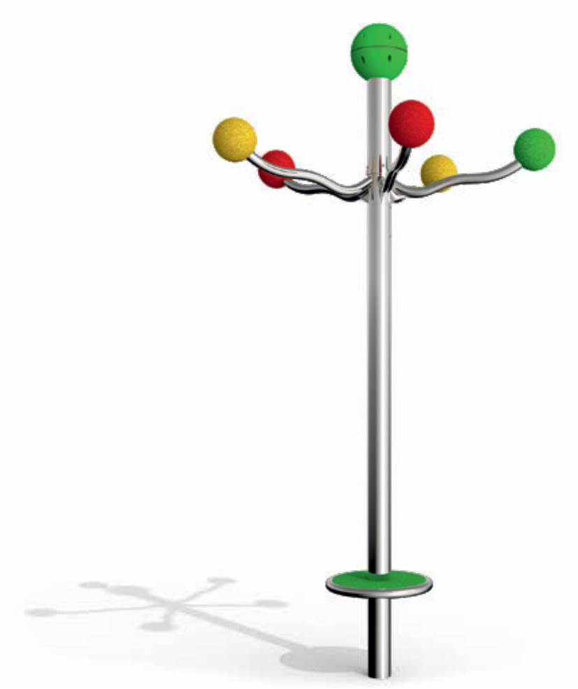
Skizze 1: Gesamtansicht des Spielgerätes