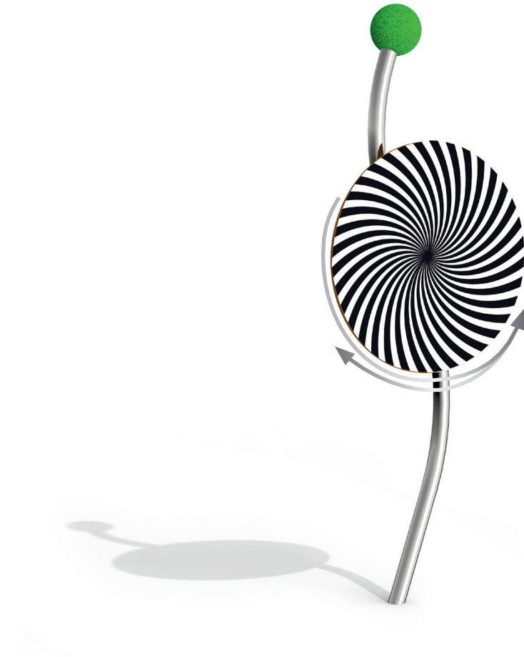
Skizze 1: Gesamtansicht des Spielgerätes