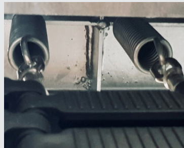
Einbausituation Federn/Matte auf der Sprungmatten-Seite mit Ösen