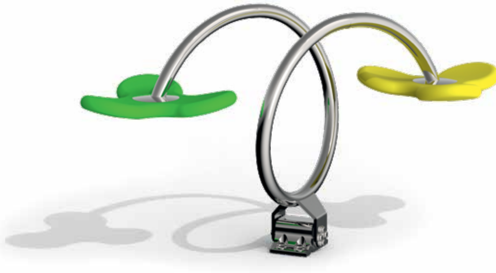
Skizze 1: Gesamtansicht des Spielgerätes